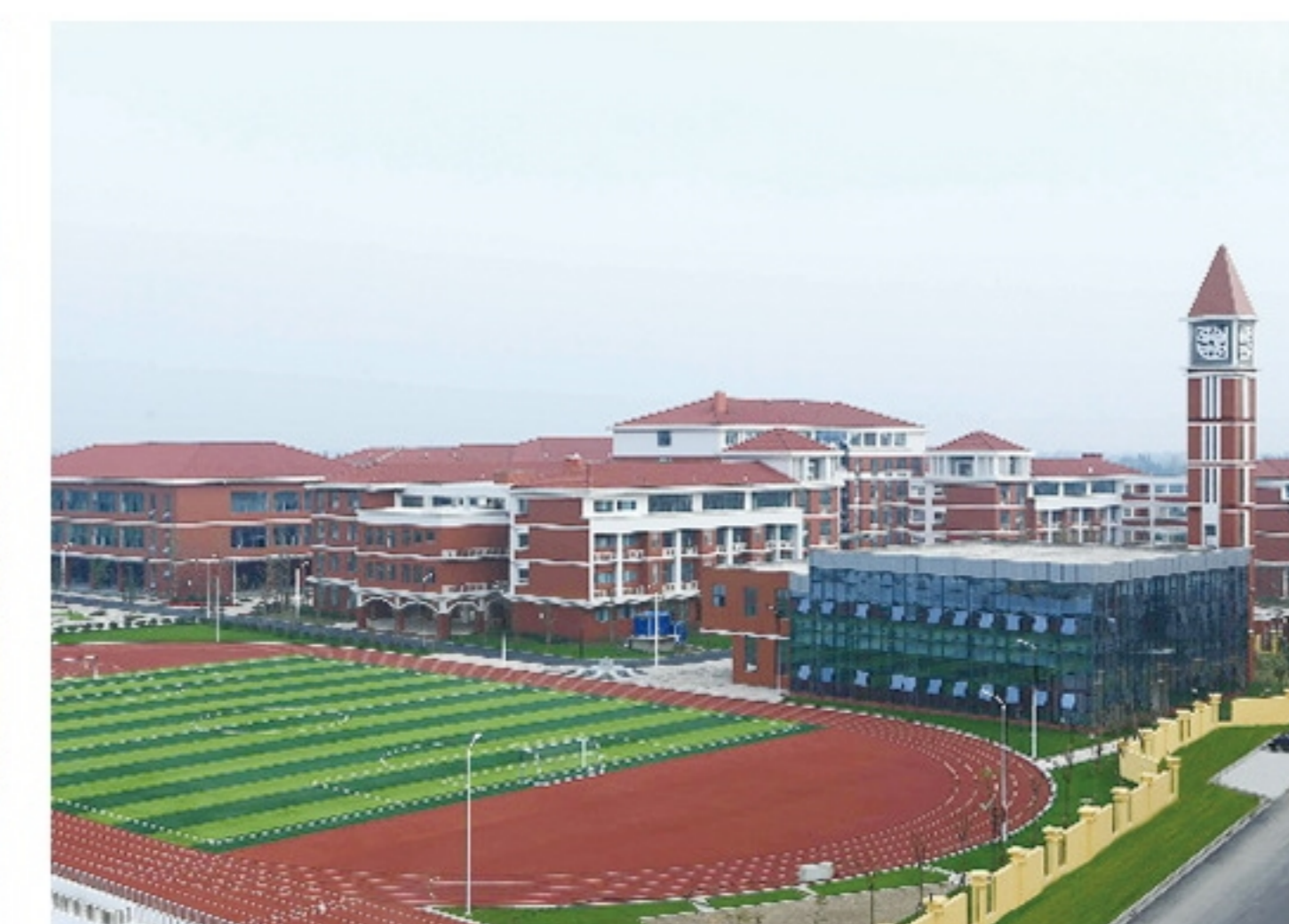
成都纺织高等专科学校