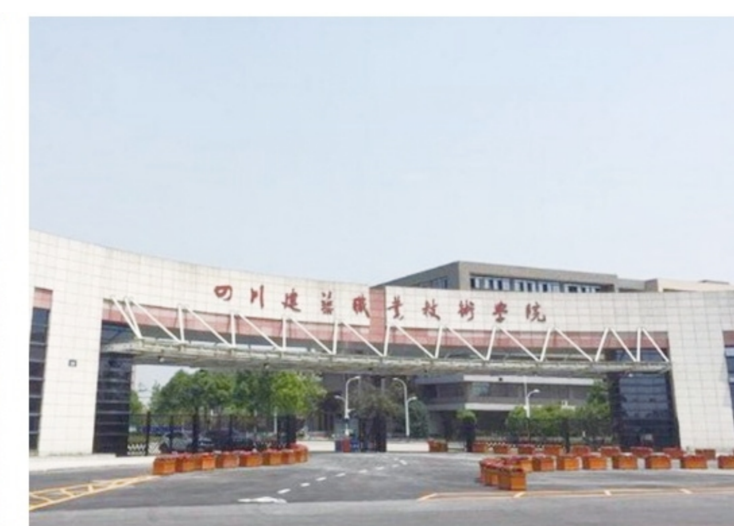
四川建筑职业技术学院