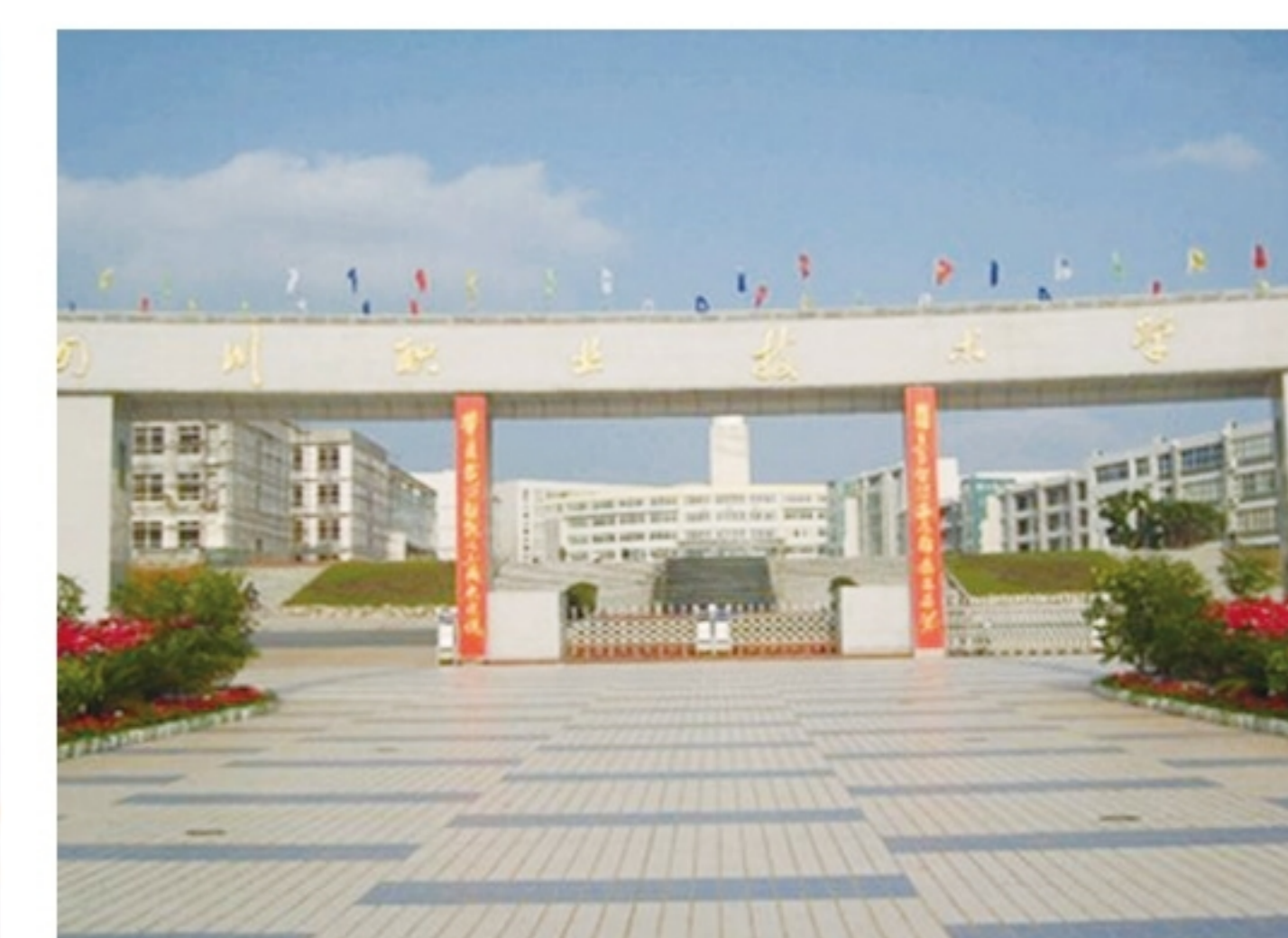
四川职业技术学院