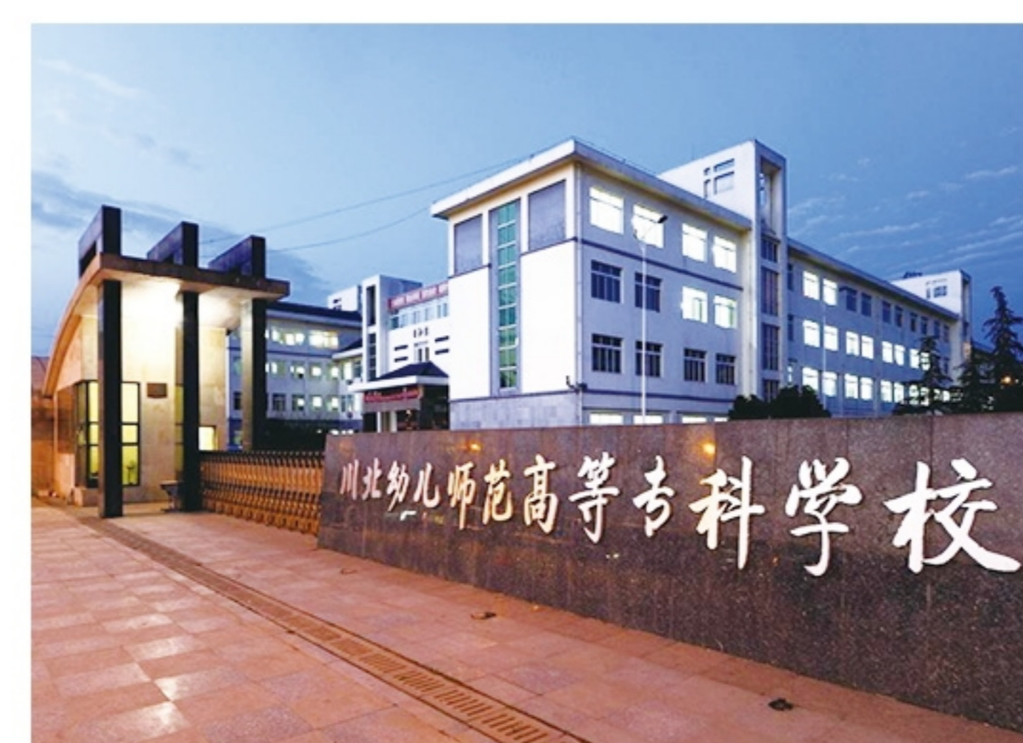
四川幼儿师范高等专科学校