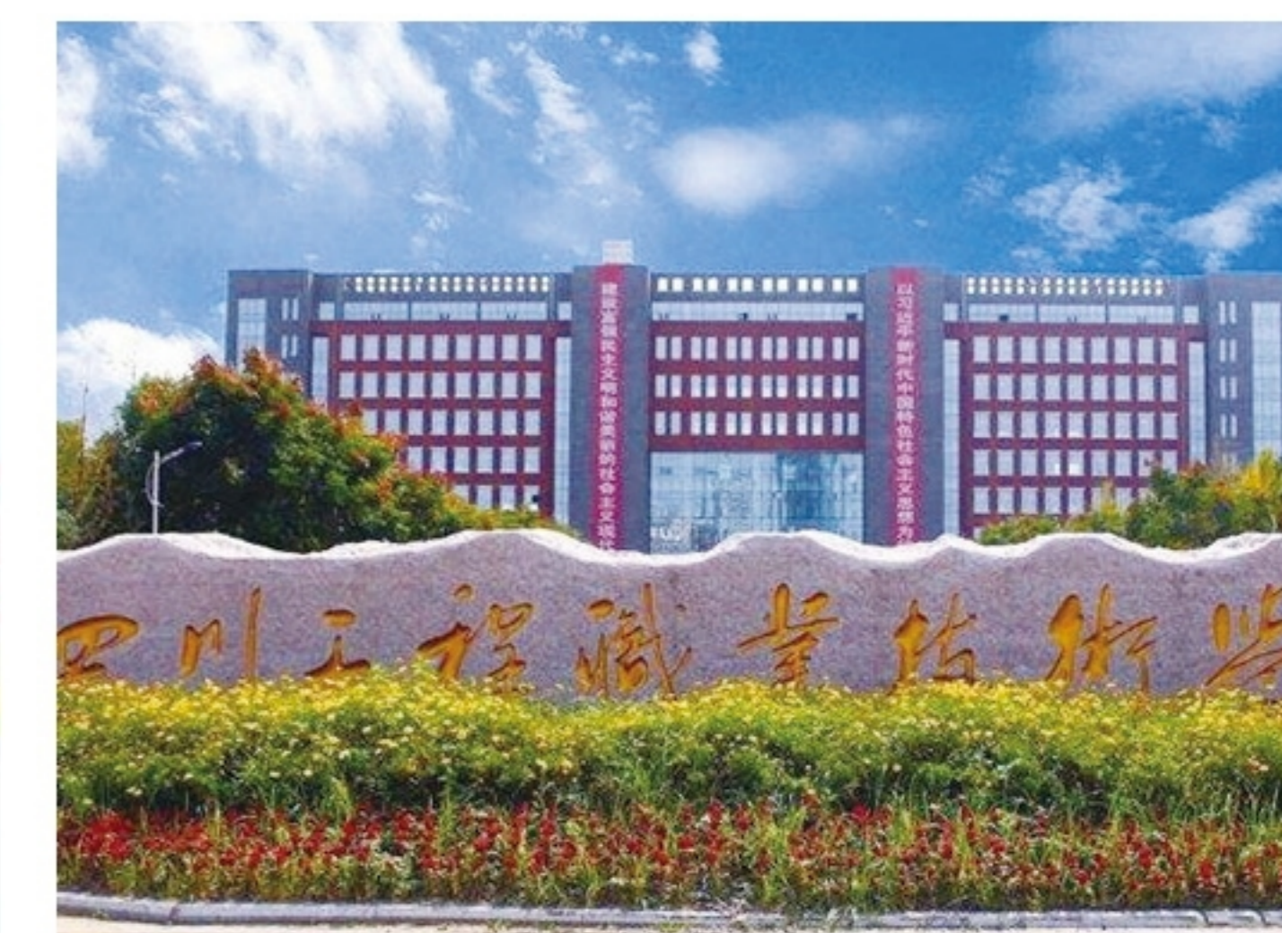
四川工程职业技术学院