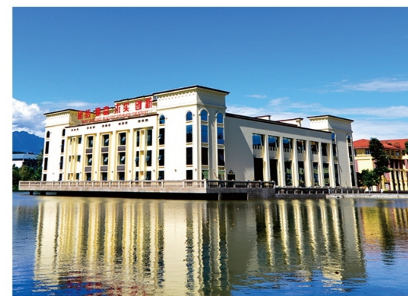
四川外国语大学成都学院