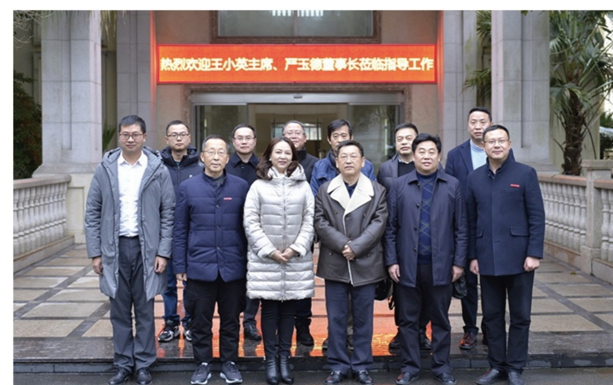
成实外教育集团领导来校指导工作