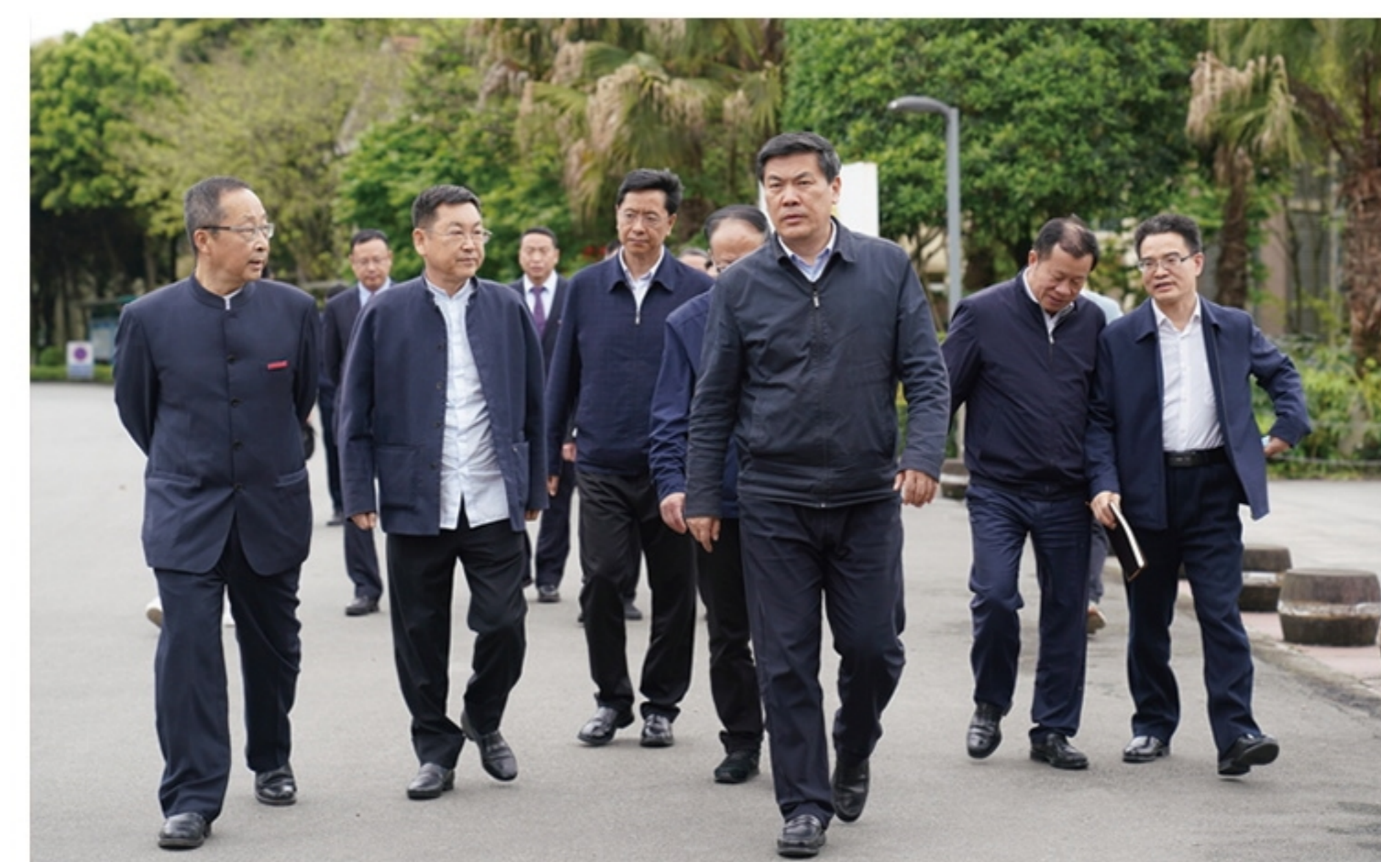
四川省副省长罗强到校调研指导工作