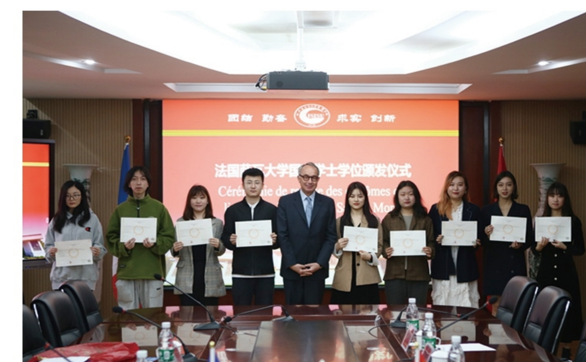
法国驻成都总领事馆总领事白屿淞一行访问我校