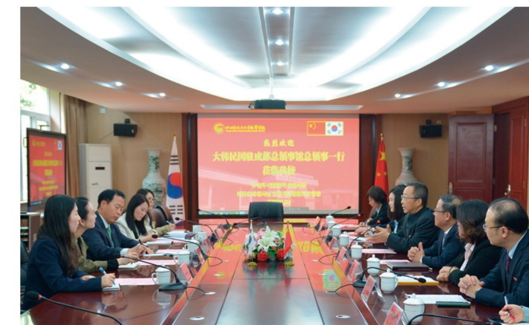
韩国驻成都总领事馆总领事李光镐一行访问我校