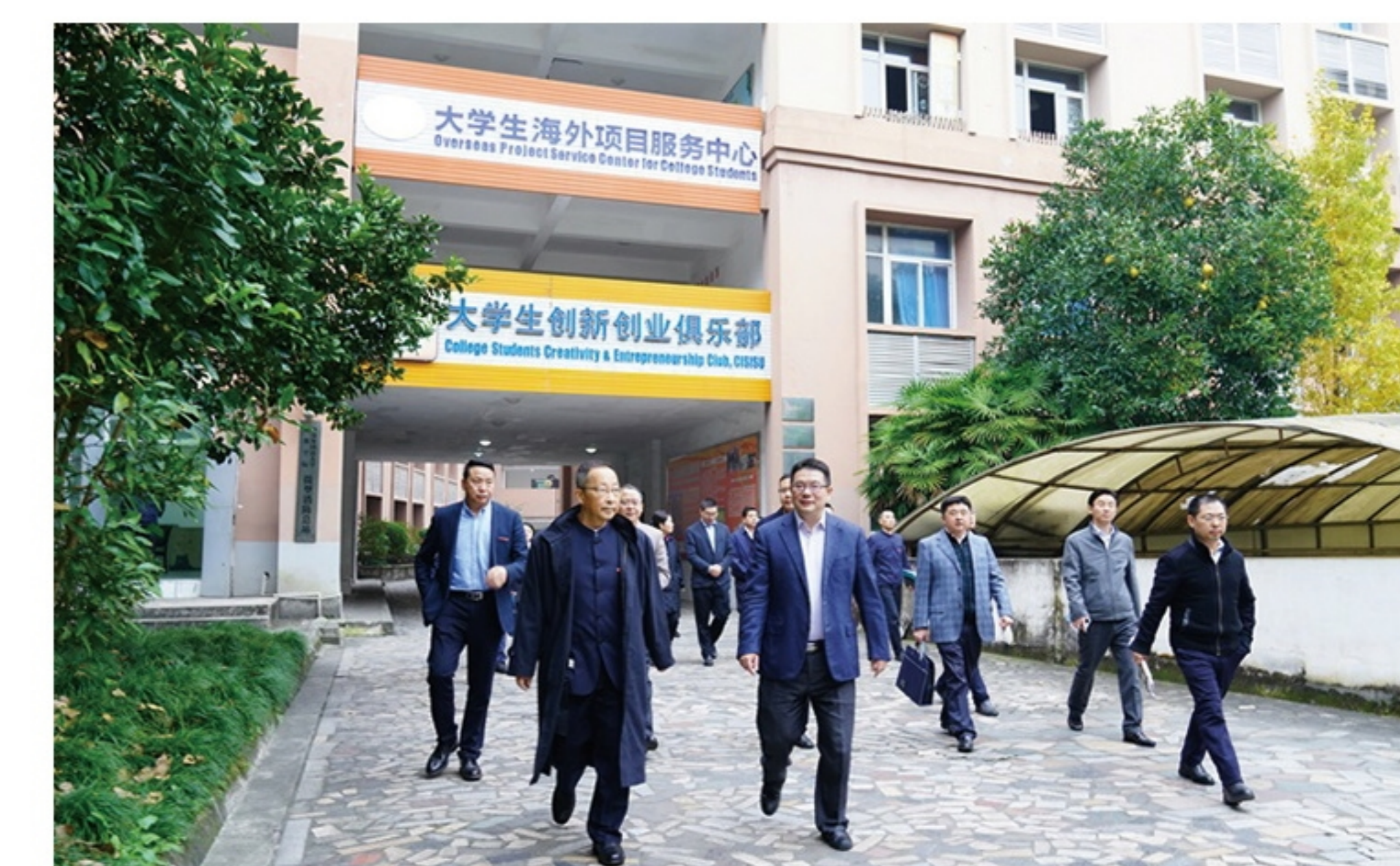
都江堰市委书记李云一行莅临学校调研指导工作